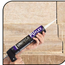
Parede de Concreto