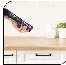
Balcão de Madeira